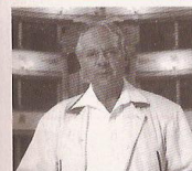
Karlheinz Stockhausen